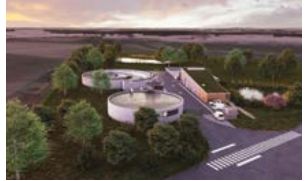
Le site sera arboré et bénéficiera d'une bande boisée dans la continuité du cavalier, ainsi que d'un verger et de bassins paysagers.

L'Agglo a entrepris la construction d'une nouvelle station d'épuration sur la commune de Haisnes. D'une capacité de 21 000 équivalent habitants, elle traitera les eaux usées des communes d'Auchy-les-Mines, Haisnes, Violaines, Douvrin et Hulluch. La première pierre a été posée le 15 mai 2025, tandis que la mise en service est prévue en 2027.