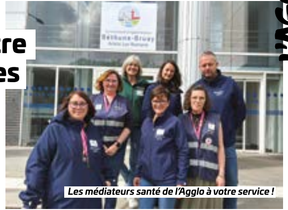
Les médiateurs santé de l'Agglo à votre service !

L'Agglo est aux petits soins pour votre santé. C'est une priorité inscrite dans son projet de territoire : viser à garantir un accès aux soins et aux droits pour tous. Pour atteindre cet objectif, neuf médiateurs santé sont à votre écoute et viennent à votre rencontre sur le territoire : dans nos quartiers politiques de la ville mais aussi, depuis cette année, au cœur de nos 61 communes rurales.