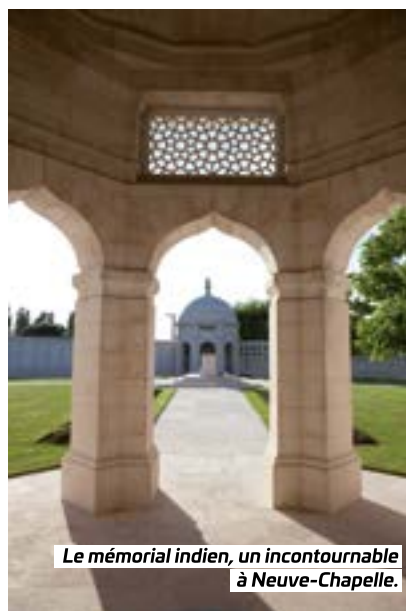
Le mémorial indien, un incontournable à Neuve-Chapelle.

➕ Plus d'infos sur www.bistrotdepays.com