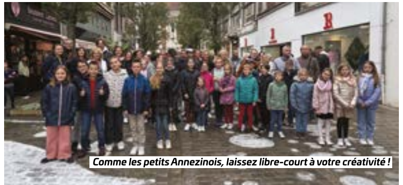
Comme les petits Annezinois, laissez libre-court à votre créativité !

Ambroise&Victor ont volontairement laissé des zones vierges et vous invitent à devenir, vous aussi, artistes le temps d'un instant ! Pour participer, rien de plus simple : rendez-vous à l'accueil de Labanque pour emprunter les craies spécialement mises à disposition. Chacun pourra alors laisser libre cours à son imagination et compléter cette œuvre collective. #