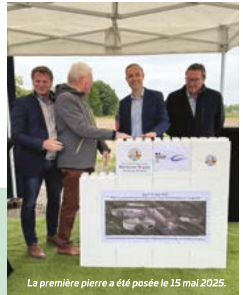
La première pierre a été posée le 15 mai 2025.

pour respecter plus encore les milieux naturels et les eaux du canal d'Aire. L'Agglo anticipe également l'évolution des normes : des équipements supplémentaires pourront être installés sur le site si besoin (pour le traitement tertiaire de l'azote et du phosphore par exemple, ou encore l'installation d'équipements de Réutilisation des Eaux Usées Traitées - REUT), pour économiser la ressource en eau. #