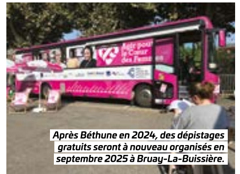
Après Béthune en 2024, des dépistages gratuits seront à nouveau organisés en septembre 2025 à Bruay-La-Buissière.

Piloté par l'Agglo, ce service gratuit pour nos habitants bénéficie de subventions de l'Agence Régionale de Santé et de l'État. # Contact : 03 21 61 50 00.