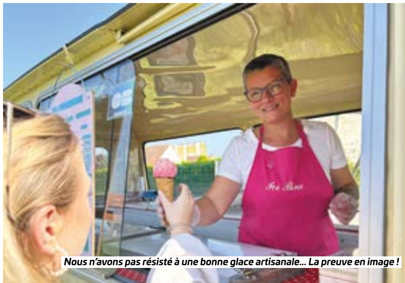
Nous n'avons pas résisté à une bonne glace artisanale... La preuve en image !