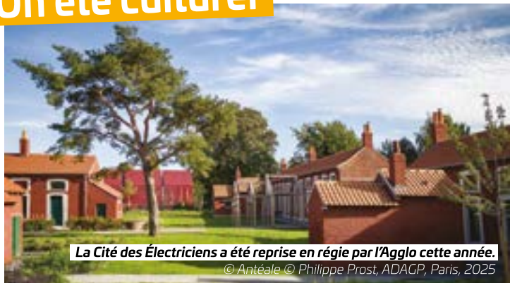
La Cité des Électriciens a été reprise en régie par l'Agglo cette année. © Antéale © Philippe Prost, ADAGP, Paris, 2025