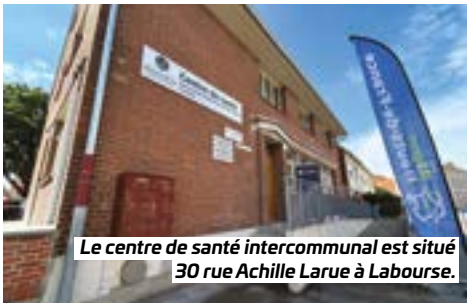
Le centre de santé intercommunal est situé 30 rue Achille Larue à Labourse.