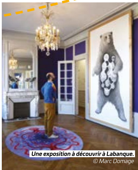
Une exposition à découvrir à Labanque.

Contact : 03 21 63 04 70. Labanque Béthune