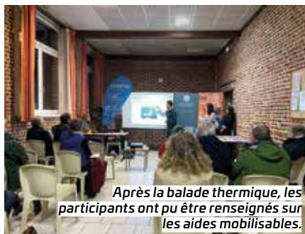
Après la balade thermique, les participants ont pu être renseignés sur les aides mobilisables.

Ponts thermiques, tassements d'isolants, problèmes d'étanchéité, etc. Une fois les faiblesses du logement identifiées, place à l'action ! En zone OPAH-RU par exemple, vous pouvez obtenir jusqu'à 80 % de financement. Attention toutefois, ne démarrez pas les travaux avant d'avoir monté votre dossier de demande de subvention. #