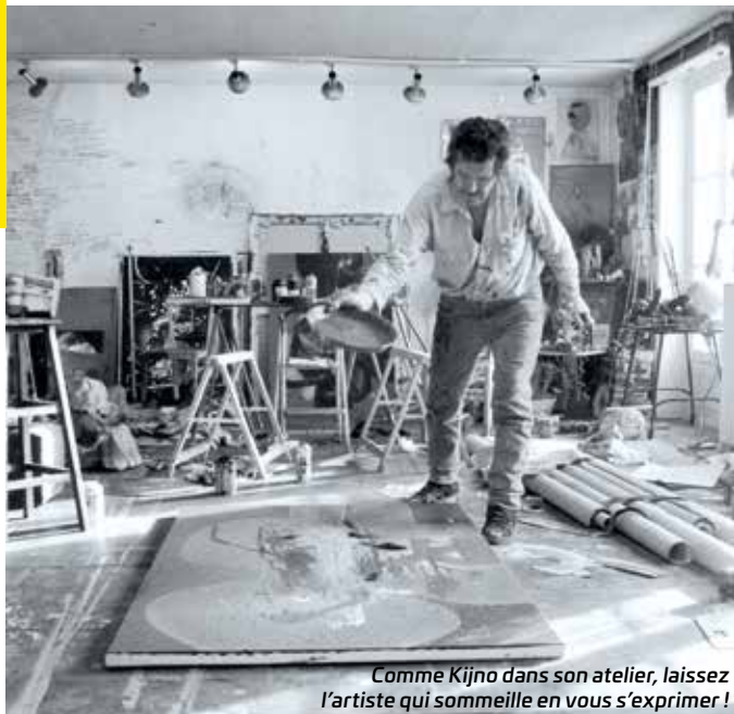
Comme Kijno dans son atelier, laissez l'artiste qui sommeille en vous s'exprimer !