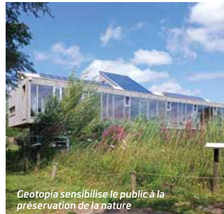
Geotopia sensibilise le public à la préservation de la nature

📞 Contact : 03 21 61 60 06, geotopia@bethunebruay.fr Programmation sur bethunebruay.fr/ geotopia et sur Geotopia