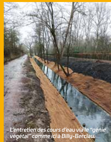
L'entretien des cours d'eau via le "génie végétal" comme ici à Billy-Berclau.

Pour protéger ces milieux fragiles, et aussi limiter le risque d'inondations qui est une priorité pour l'Agglo, la végétation est entretenue dans les cours d'eau et zones humides. Des aménagements sont aussi entrepris pour prendre soin des animaux aquatiques. #