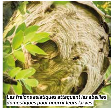
Les frelons asiatiques attaquent les abeilles domestiques pour nourrir leurs larves.

ont été dotés de sept pistolets insecticides de longue portée et de 20 000 balles insecticides pour les neutraliser. #