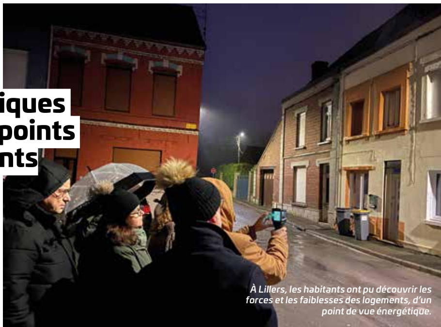
À Lillers, les habitants ont pu découvrir les forces et les faiblesses des logements, d'un point de vue énergétique.

Dans le cadre de l'OPAH-RU (Opération programmée d'Amélioration de l'Habitat et de Renouvellement Urbain), l'Agglo vous propose des balades thermiques, en partenariat avec les communes concernées. Le principe : parcourir certaines rues de votre ville, muni d'une caméra thermique, et ainsi identifier les pertes de chaleur.