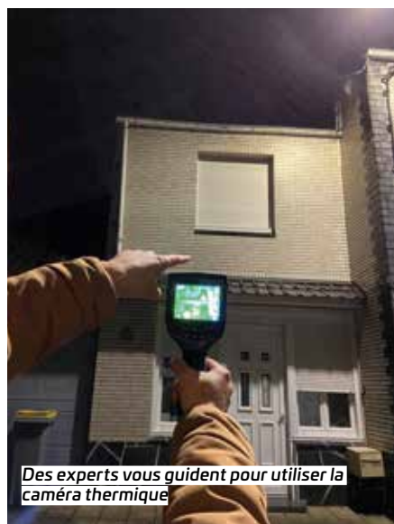
Des experts vous guident pour utiliser la caméra thermique