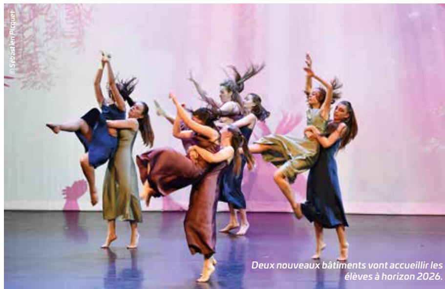
Deux nouveaux bâtiments vont accueillir les élèves à horizon 2026.

Les élèves habitent dans pas moins de 80 communes du territoire