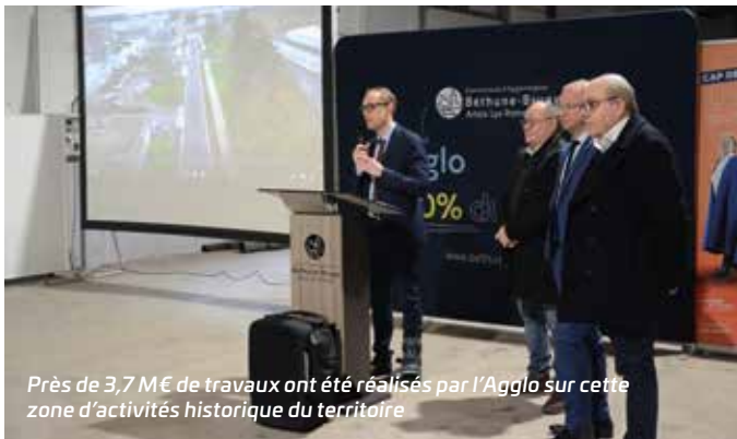
Près de 3,7 M€ de travaux ont été réalisés par l'Agglo sur cette zone d'activités historique du territoire

Depuis près de 56 ans, cette zone d'activités historique du territoire accueille une trentaine d'entreprises. Près de 3,7 M€ de travaux ont été engagés par l'Agglomération pour que les entreprises et leurs employés profitent d'un environnement optimisé et sécurisé.