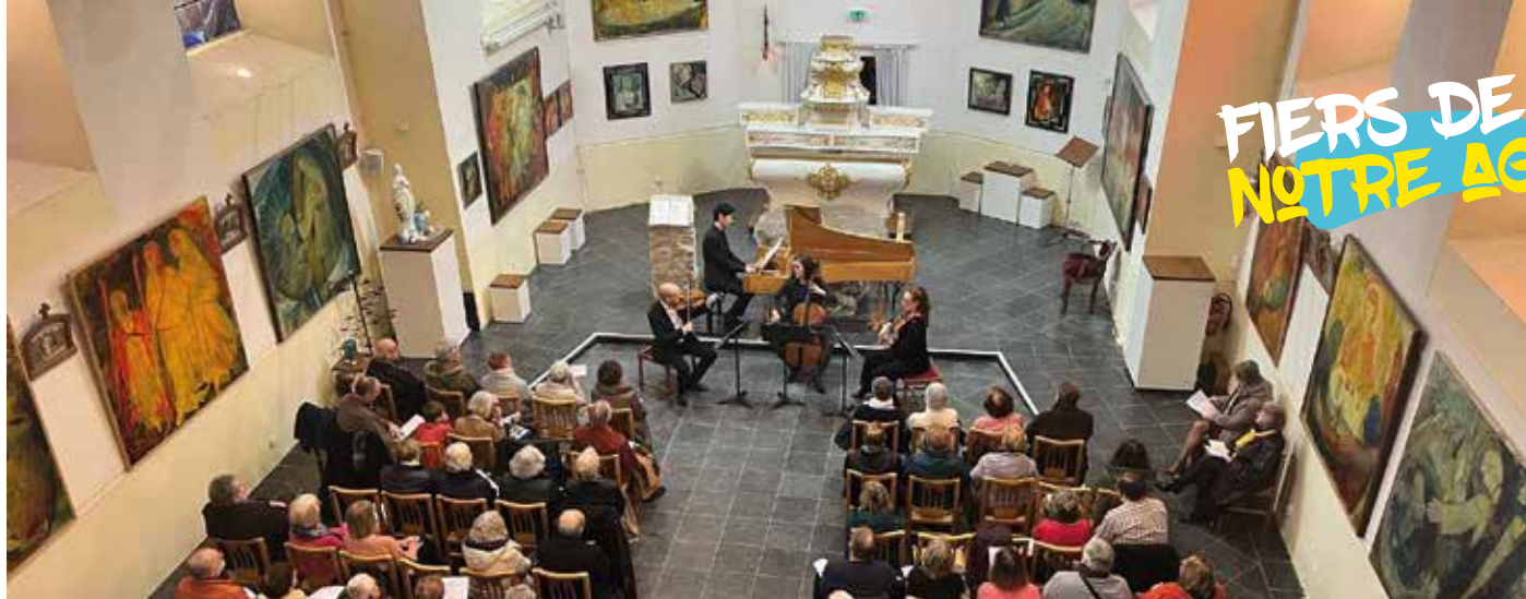
L'Unité d'Art Sacré, au cœur de l'église Saint-Léger de Gosnay, accueille de nombreux concerts.