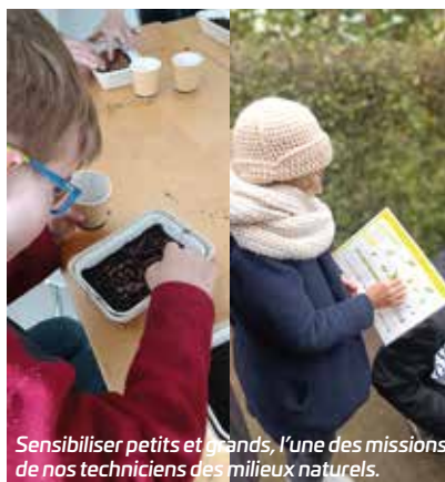
Sensibiliser petits et grands, l'une des missions de nos techniciens des milieux naturels.

En lien avec la Maison de la nature Geotopia, ils ont un rôle important de sensibilisation auprès des élus et des riverains directement sur site. #